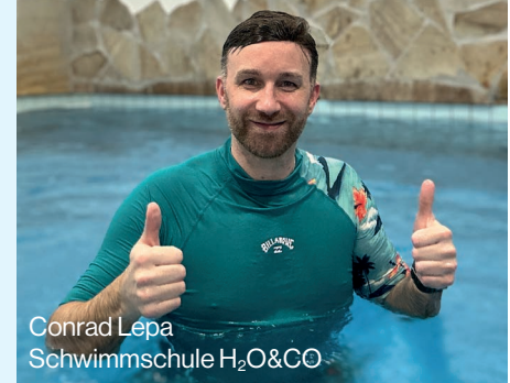
Conrad Lepa Schwimmschule H 2 O&CO

Seit 2024 sind wir mit der Schwimmschule H 2 O&CO aus Hopsten Partner des VfRG e.V. und sind sehr froh darüber, mit diesem Rehasport-Verein zusammenarbeiten zu dürfen. Von Minute 1 an fühlen wir uns hier sehr gut aufgehoben. Der VfRG übernimmt für uns organisatorische Arbeiten, die uns im operativen Geschäft entlasten. Hier sei exemplarisch die Mitgliederverwaltung genannt. Natürlich liegt uns jeder einzelne Teilnehmer am Herzen, jedoch verbirgt sich hinter jedem ein organisatorischer Berg an Arbeit. Der VfRG unterstützt uns u. a. durch die Bereitstellung einer Software, bei der die Teilnahmen der Patienten digital und geschützt über den VfRG an die Krankenkassen weitergeleitet werden.